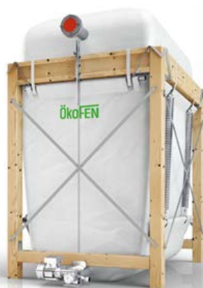
TECNICA DI MAGAZZINAGGIO