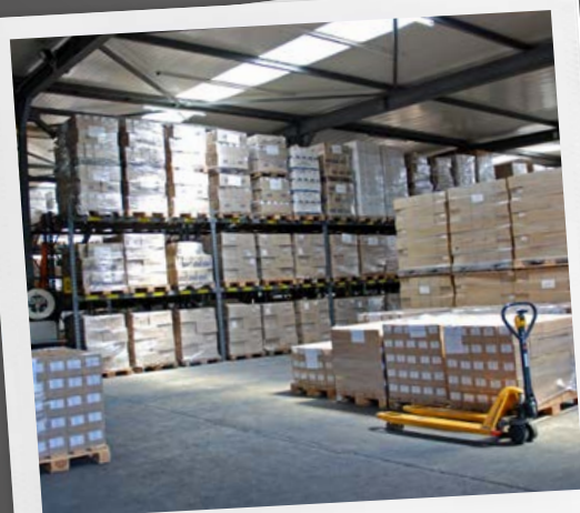
... riscaldamento di magazzini