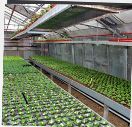
... riscaldamento di serre