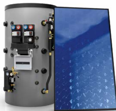
TECNOLOGIA SOLARE E DI ACCUMULO