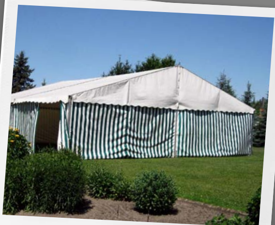
... riscaldamento nelle tende