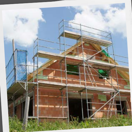
... riscaldamento di cantieri