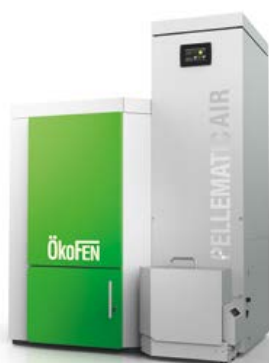
TECNICA DI RISCALDAMENTO