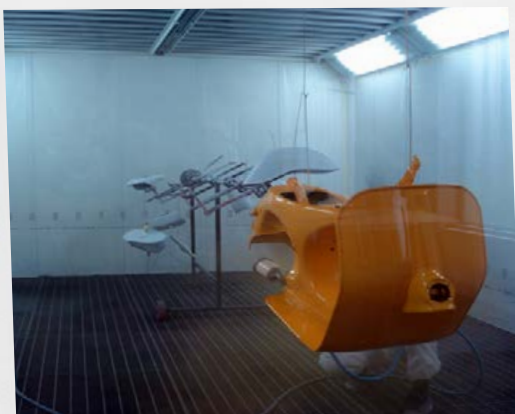
... riscaldamento di cabine di verniciatura